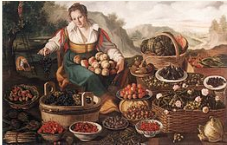
Vincenzo Campi: La fruttivendola (circa 1580)