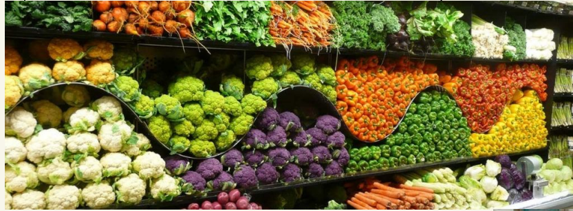
Il reparto della frutta e verdura. L'ortofrutta.