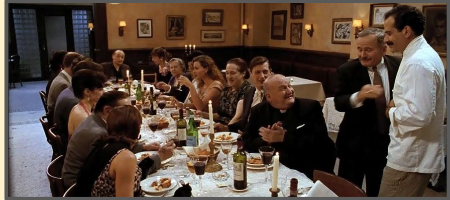
Big Night (1996)

Mangiare a tavola con la famiglia è un rito molto importante per gli italiani!