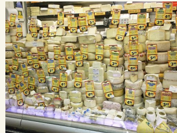
Il reparto formaggi