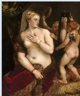
Artemisia Gentileschi (1625-30). Venere e Cupido.