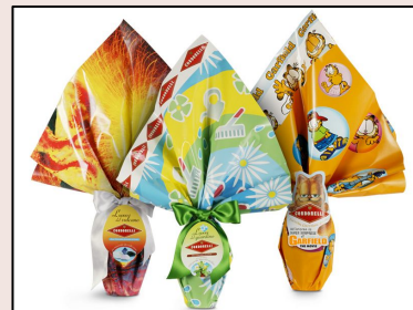
L'uovo di cioccolato

La Quaresima era il 17 febbraio. La Domenica delle Palme è il 28 marzo. Il Giovedì Santo è il primo aprile. Il Venerdì Santo è il 2 aprile. Il Sabato Santo è il 3 aprile. Pasqua è il 4 aprile. Pasquetta (Il lunedì dell'Angelo) è il 5 aprile.